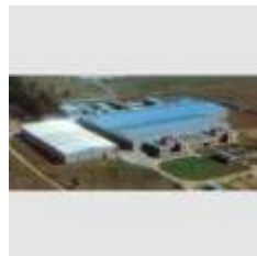
PLANTA TEXTIL Monte Caseros, Corrientes TEXTIL NORESTE SA

Año 2000-1978 Proyecto y Dirección, 22.000m2