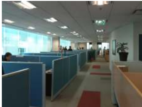
NALCO ARGENTINA SRL Puerto Madero 250m 2

Proyecto y Dirección de Obra de un nuevo edificio para Depósito de Producto Terminado. Instalaciones generales, playa de maniobras y área semicubierta para carga.