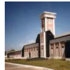
PLANTA DE PAPEL TISSUE Bernal, Buenos Aires KIMBERLY CLARK ARGENTINA SA - KCK

Año 1997-1999 Proyecto y Dirección, 4.800 m2 Primer premio, Concurso Nacional