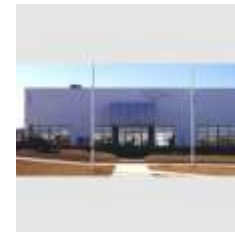
PLANTA DE AUTOPARTES AUTOLIV ARGENTINA SA Pilar, Buenos Aires