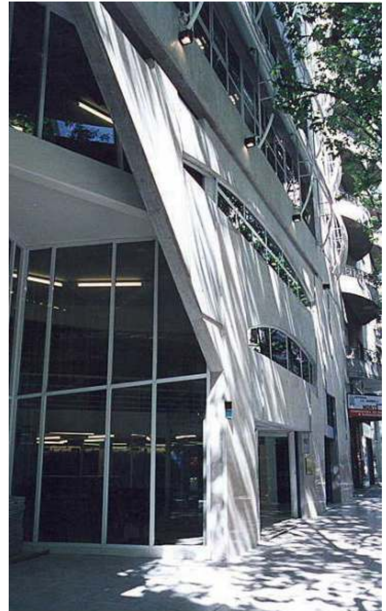
OFICINAS Y EQUIPAMIENTO URBANO

AV. SANTA FE 1821 piso 4 BUENOS AIRES ARGENTINA +5411 4.812.5549 www.estudiosevi.com.ar gsevi@estudiosevi.com.ar ujsevi@estudiosevi.com.ar