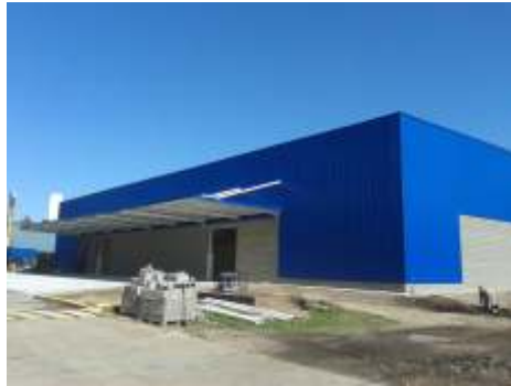
NALCO ARGENTINA SRL (ECOLAB) PARQUE INDUSTRIAL PILAR DEPOSITO DE PRODUCTO TERMINADO 2.500m 2

Proyecto y Dirección de Obra de un nuevo edificio para Depósito de Producto Terminado. Instalaciones generales, playa de maniobras y área semicubierta para carga.