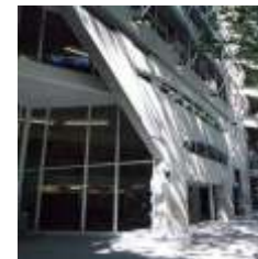
COLEGIO DE ESCRIBANOS DE LA CAPITAL FEDERAL

Año 2000-1978 Proyecto y Dirección, 22.000m2