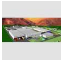
PLANTA DE PAÑALES Y TISSUE KIMBERLY CLARK ARGENTINA SA San Luis

Año 1999 Proyecto y Dirección, 15.000 m2