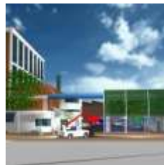
PLANTA DE PAPEL Bernal, Buenos Aires SMURFIT SA

Año 2000 Plan Maestro. Proyecto, 50.000 m2