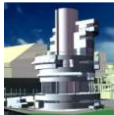
PLANTA CEMENTERA/ Edificio de Control Olavarría CEMENTO AVELLANEDA SA

Año 2000 Plan Maestro. Proyecto, 50.000 m2