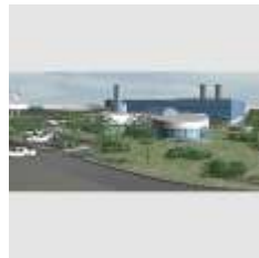
PLANTA PRODUCTOS QUIMICOS ASTA Medica/Degussa Pilar, Buenos Aires

Año 1999 Proyecto y Dirección, 15.000 m2