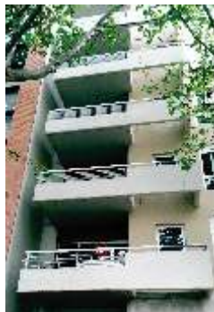
ALTOLAGUIRRE 2249 SA Villa Urquiza 1500m 2

Oficinas Corporativas Reorganización de sectores gerenciales de acuerdo a nuevas tipologías de la Empresa.